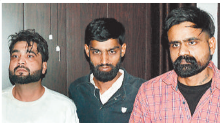
पुलिस की गिरफ्त में आरोपी।

पकड़े गए आरोपियों में एक युवक मूलतः पंजाब का रहने वाला है। वह पंजाब से हेरोइन लाकर साथियों के साथ पुड़िया बनाकर 3 हजार रुपए में बेच रहा था। जस्ट हिरोइन को पंजाब में चिट्ठा कहा जाता है। इसी चिट्ठा की गिरफ्त में आकर पंजाब के बड़ी संख्या में युवा नशेड़ी हो गए थे। आरोपी पंजाब के बाद जिले को उड़ता पंजाब बनाने में लगे हुए थे। समय पूर्व तीनों को पकड़कर सलाखों के पीछे डाल दिया गया।