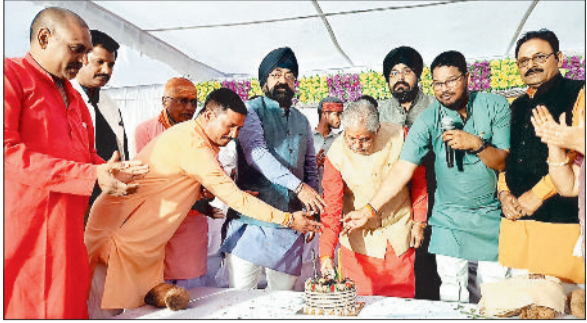
रविवार को बिल्हा विधायक धरमलाल कौशिक का जन्मदिन मनाते समर्थक।

सरगांव। बिल्हा विधायक धरमलाल कौशिक का जन्मदिन हर्षोल्लास के साथ मनाया गया। इस अवसर को और भी यादगार बनाते हुए विधायक ने उज्वला योजना के तहत हितग्राहियों को गैस सिलेंडर व चूल्हा वितरण किया। उन्होंने सरगांव में 12 करोड़ रुपए विकास कार्यों की स्वीकृति की जानकारी दी।