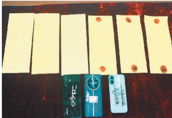
आरोपियों से जब्त हेरोइन।