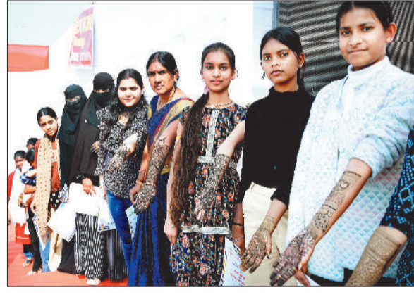
मेहंदी लगाकर प्रतिभागियों के चेहरे खिल उठे।