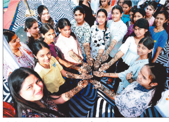
हरिभूमि के आयोजन में भाग लेकर प्रतिभागी उत्साहित।