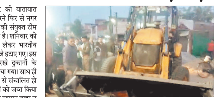
इन सड़कों पर भी चली कार्रवाई

बिलासपुर। शहर की यातायात व्यवस्था दुस्तूरत करने फिर से नगर निगम और पुलिस की संयुक्त टीम ने कार्रवाई शुरू की है। शनिवार को मगरपारा चौक से लेकर भारतीय नगर चौक तक कब्जे हटाए गए। इस दौरान सड़क में रखे दुकानों के सामान को जबाब किया गया। साथ ही चौक में अवैध रूप से संचालित हो रहे ठेला व गुमटियों को जब्त किया गया। दुकानदारों को सामान बाहर न रखने की चेतावनी दी गई है। खासतौर पर मगरपारा के तैयबा चौक, इंदगाह चौक और बजरंग चौक पर अवैध रूप से कब्जों को हटाया गया। इस दौरान कुछ दुकानदारों ने विरोध भी किया। बाते कुछ दिनों से नगर निगम की अतिक्रमण विरोधी दस्ता की कार्रवाई बंद थी। शनिवार की सुबह से दस्ता फिर से सक्रिय हो गया। इसी के तहत अतिक्रमण टीम ने मगरपारा चौक से कार्यवाही शुरू की और