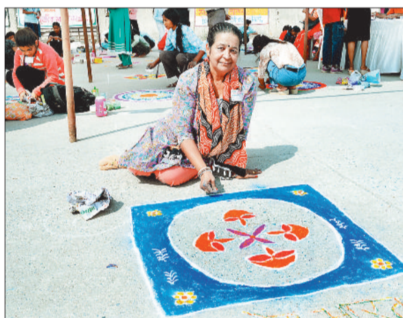
सीनियर वर्ग में बनाई जगह।