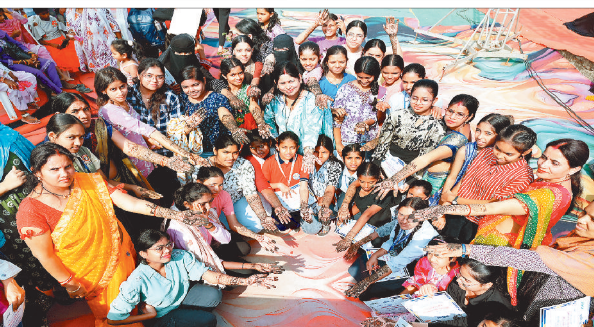
स्पर्धा में बड़ी संख्या में हर आयु वर्ग के प्रतिभागियों ने लिया हिस्सा।