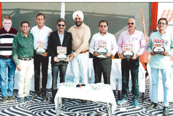
बीएनआई ने हरिभूमि ग्रुप का किया सम्मान।