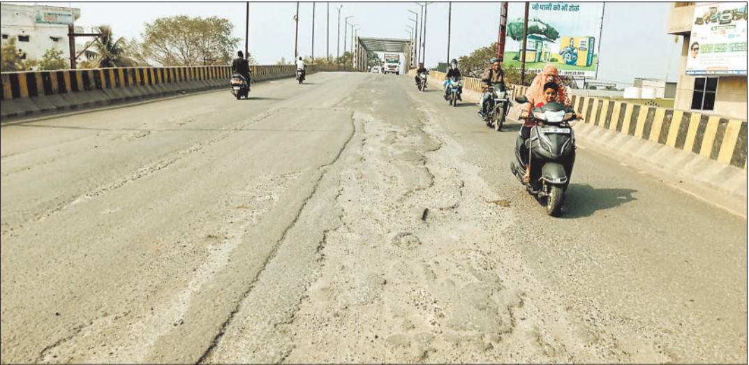
हरिभूमि न्यूज ►► बिलासपुर

बिलासपुर। लालखदान ओवर ब्रिज इन दिनों खस्ताहाल है। रोजाना 10 हजार से अधिक वाहनों की आवाजाही होने के कारण ब्रिज पर बड़े बड़े गड्ढे बन चुके हैं। सड़क की हालत यह है कि गड्ढों के कारण ब्रिज के बीच से गाड़ी नहीं चल रही है, लोगों को गाड़ी खराब होने का अंदेशा रहता है, ऐसे में ब्रिज के किनारे से गाड़ी निकलने की नौबत आ चुकी है। सेतु विभाग द्वारा बनाए गए लापरवाही लोगों पर भारी पड़ रही है। हर साल बारिश के बाद अंडर ओवर ब्रिज के मरम्मत व रखरखाव का काम करने वाले सेतु विभाग के अधिकारियों को ब्रिज की हालत का अंदाजा तक नहीं है। एसी चेंबर में बैठने वाले अधिकारी फिल्ड में निकलकर इन ब्रिज की हालत नहीं देख पा रहे हैं। लालखदान ब्रिज से होकर गुजरना लोगों के लिए बड़ी चुनौती साबित हो रही है। बताया जा रहा है कि सड़क का डामर उखड़ चुका है। यहां से रोजाना 10 हजार से अधिक वाहन गुजर रहे हैं, जिससे चलते सड़क पर धूल उड़ रही है। सबसे ज्यादा मुसीबत लालखदान क्षेत्र के रहवासियों को उठानी पड़ रही है, धूल के कारण उनके घरों में मिट्टी की परत जम चुकी है, ब्रिज के नीचे से गई मोहल्ले का हाल बेहाल है। स्वास्थ्यगत कारणों के चलते बच्चे और बुजुर्गों को परेशानी झेलनी पड़ रही है।