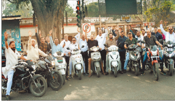
बंद कराने निकले सर्व स्वर्ण के पदाधिकारी व सदस्य।

शहर के भीतर धरना-प्रदर्शन से ट्रैफिक व्यवस्था प्रभावित व हो इसके लिए शहर के बाहर उपलब्ध कई स्थानों को विकल्प के रूप में देखा जा सकता है। साइंस कॉलेज का मैदान काफी बड़ा है। इसी तरह साइंस कालेज मार्ग पर ही स्थित खेल परिसर से ही कर्मचारी संगठनों द्वारा अपनी रैली की शुरूआत व समापन कर सभा आयोजित की जाती है। ऐसे में यह स्थान भी बेहतर विकल्प साबित हो सकता है। बहतलाई स्थित स्टेडियम भले ही शहर से कुछ दूरी पर है, लेकिन धरना-प्रदर्शन के लिए यह बेहतर विकल्प है। कोनी स्थित कमिश्नर कार्यालय के पीछे नगर निगम द्वारा तैयार एक बाईपास सड़क भी धरना-प्रदर्शन के लिए अच्छा विकल्प बन सकती है।