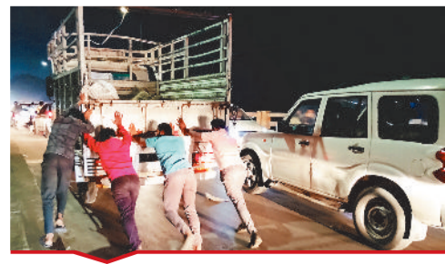
रविवार को उसलापुर ओवरब्रिज पर वाहन खराब होने के कारण धक्का लगाते लोग। जिसके चलते घंटी लगा रहा जाम।

[ बिल्हा | मस्तूरी | तखतपुर | मुंगेली | कोटा | लोरमी | सरगांव | पेंड़ा | बेलतरा | रतनपुर | पथरिया ]