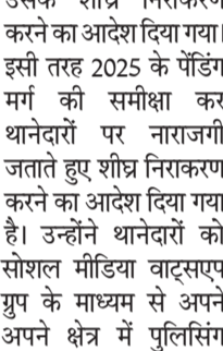
एसएसपी ने ली क्राइम मीटिंग