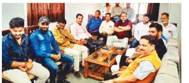
केंद्रीय बजट का लाइव प्रसारण सुनते भाजपा कार्यकर्ता।

सीपत। भारतीय जनता पार्टी सीपत मंडल के पदाधिकारियों और कार्यकर्ताओं ने सीपत विश्राम गृह में सामूहिक रूप से लोकसभा में प्रस्तुत केंद्रीय बजट का लाइव प्रसारण देखा। जैसे ही केंद्रीय वित्त मंत्री निर्मला सीतारमण ने लगातार नौवीं बार संसद में बजट प्रस्तुत किया, वहां मौजूद कार्यकर्ताओं में उत्साह और जिज्ञासा का माहौल दिखाई दिया।