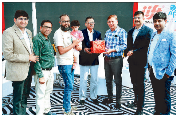
नर्तन विजेताओं को दिया गया पुरस्कार।