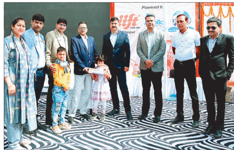
व्यापार व उद्योग मेले में हरिभूमि द्वारा आयोजित कार्यक्रम में अतिथियों का सम्मान किया गया। प्रतिभागियों द्वारा बनाई गई रंगोली व मेहंदी का अवलोकन करती निर्णायक। स्पर्धा में पुरस्कृत किए गए बच्चे।